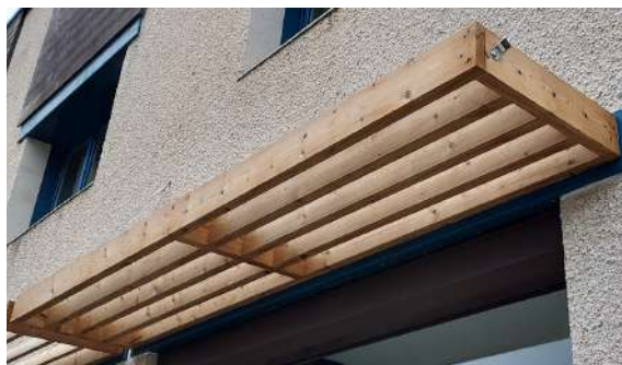
Brise-soleil fixes en épicéa T.H.T., lames droites :