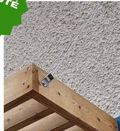
Vue de détail des fixation des lames

Brise-soleil fixes en épicéa T.H.T., lames droites: