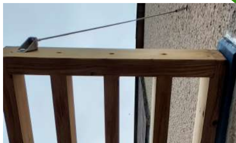
Vue de détail fixation tirant inox sur façade